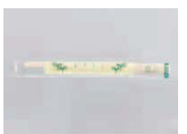
リーフイエローOPP完封箸